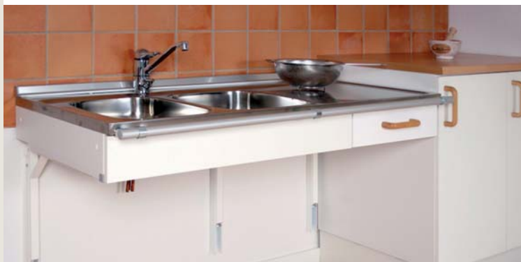
Barrierefreie höhenverstellbare Küche