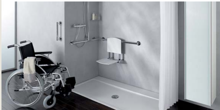
Barrierefreie Dusche