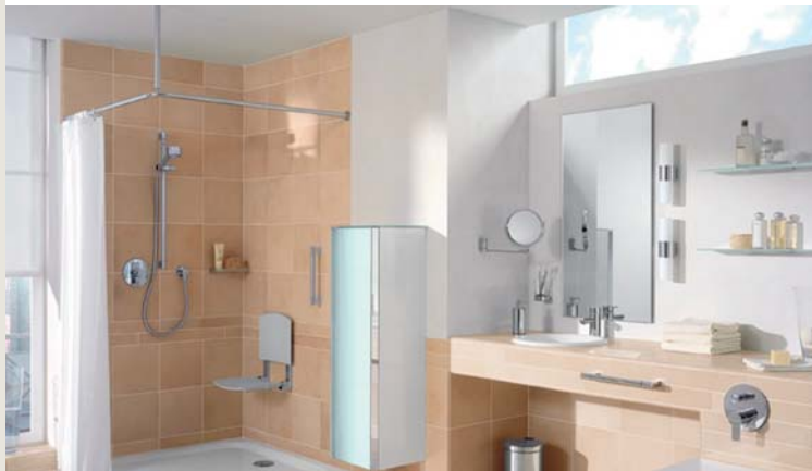
Barrierefreies Bad

„Dieses kommt allen Menschen, mit und ohne Behinderungen, zugute.“ [Zitat aus der DIN 18030E]