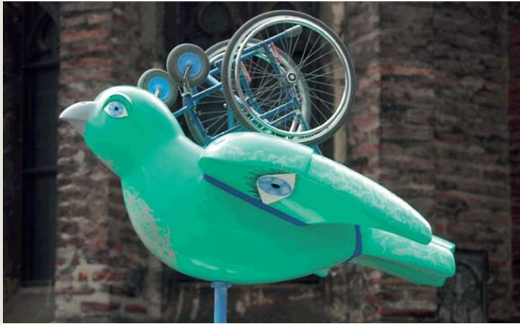
Wurde vom Club „Körperbehinderte und ihre Freunde“ kreiert

„...noch weit davon entfernt, dass Barrierefreiheit ein selbstverständliches Kriterium der Wohnungs- und Stadtplanung ist.“